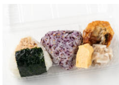
おにぎり2個+惣菜3種セットB(サバの竜田揚げ/しゅうまい/玉子)セット 540円（税込）