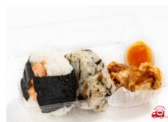
おにぎり2個+揚げしゅうまいセット 540円（税込）