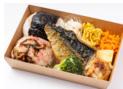
選べる俵おにぎり+サバの塩焼き弁当 880円（税込）