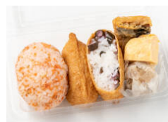
俵おにぎり&いなり寿司と惣菜3種セットB(サバの竜田揚げ/しゅうまい/玉子)セット 580円（税込）