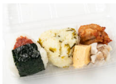
おにぎり2個+惣菜3種A(唐揚げ・しゅうまい・玉子)セット 540円（税込）