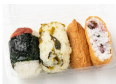
俵おにぎり+いなり寿司セット 580円（税込）