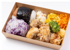
選べる俵おにぎり+唐揚げ弁当 880円（税込）