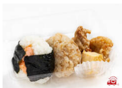
おにぎり2個+たまからセット 560円（税込）