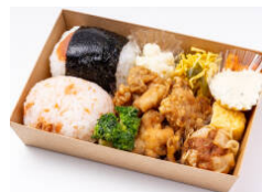
選べる俵おにぎり+タルタル鶏南蛮弁当 920円（税込）