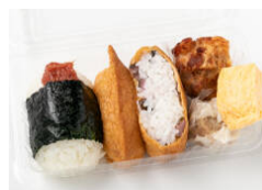
俵おにぎり&いなり寿司と惣菜3種A(鶏の唐揚げ/しゅうまい/玉子)セット 580円（税込）