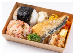
選べる俵おにぎり+サバの竜田揚げ弁当 900円（税込）