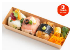
ご馳走おにぎり3個セット 750円（税込）