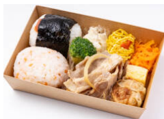
選べる俵おにぎり+生姜焼き弁当 880円（税込）