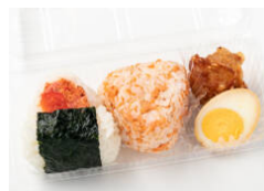
おにぎり2個+惣菜2種セット 520円（税込）