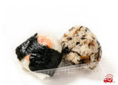
おにぎり2個セット 390円（税込）